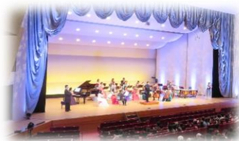
前回のコンサート（会場：出雲市民会館）▶